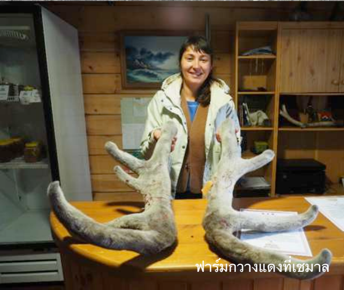
ฟาร์มกวางแดงที่เชมาล