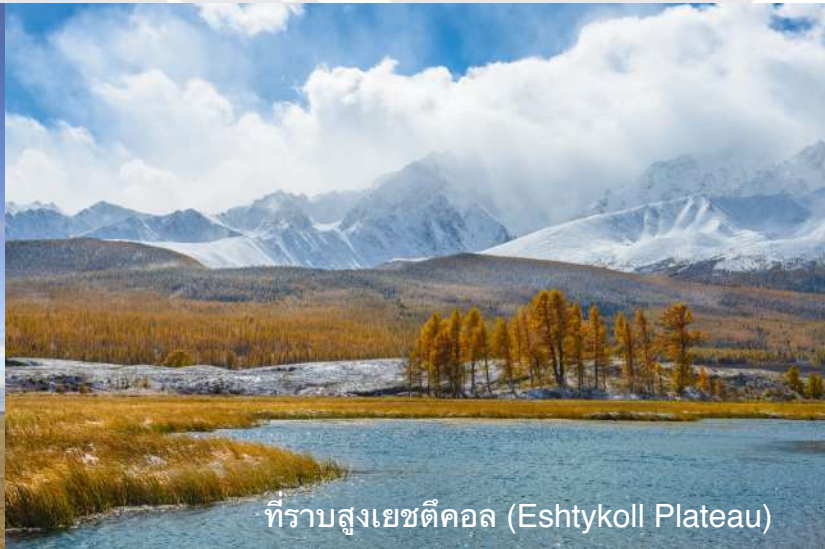
ที่ราบสูงเยชตีคอลล (Eshtykoll Plateau)