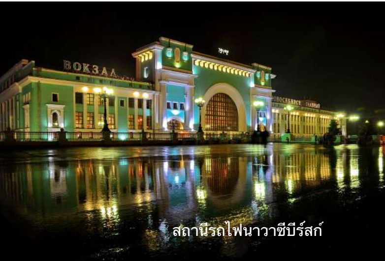
สถานีรถไฟนาวาซีบีร์สค์