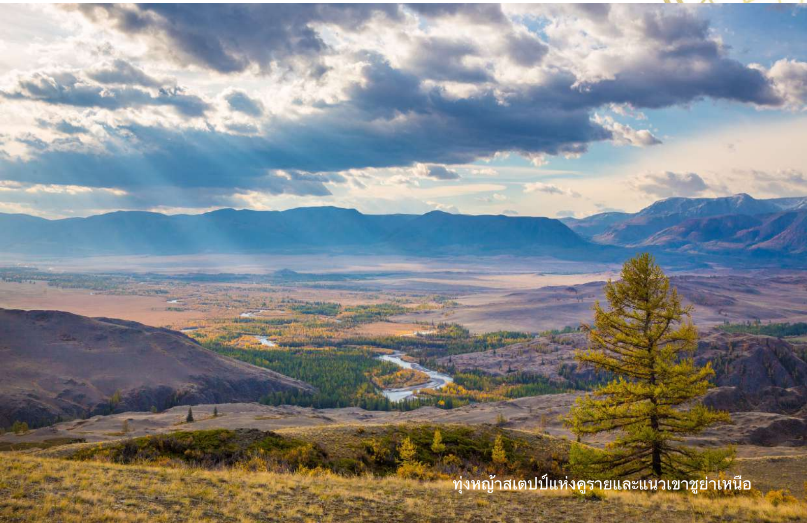
ทุ่งหญ้าสเดปป์แห่งคูรายและแนวเขาซูย่าเหนือ