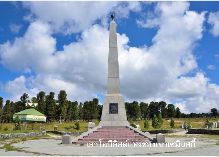
เสาโอปอลิสต์แห่งช่องเขาเซมินสกี