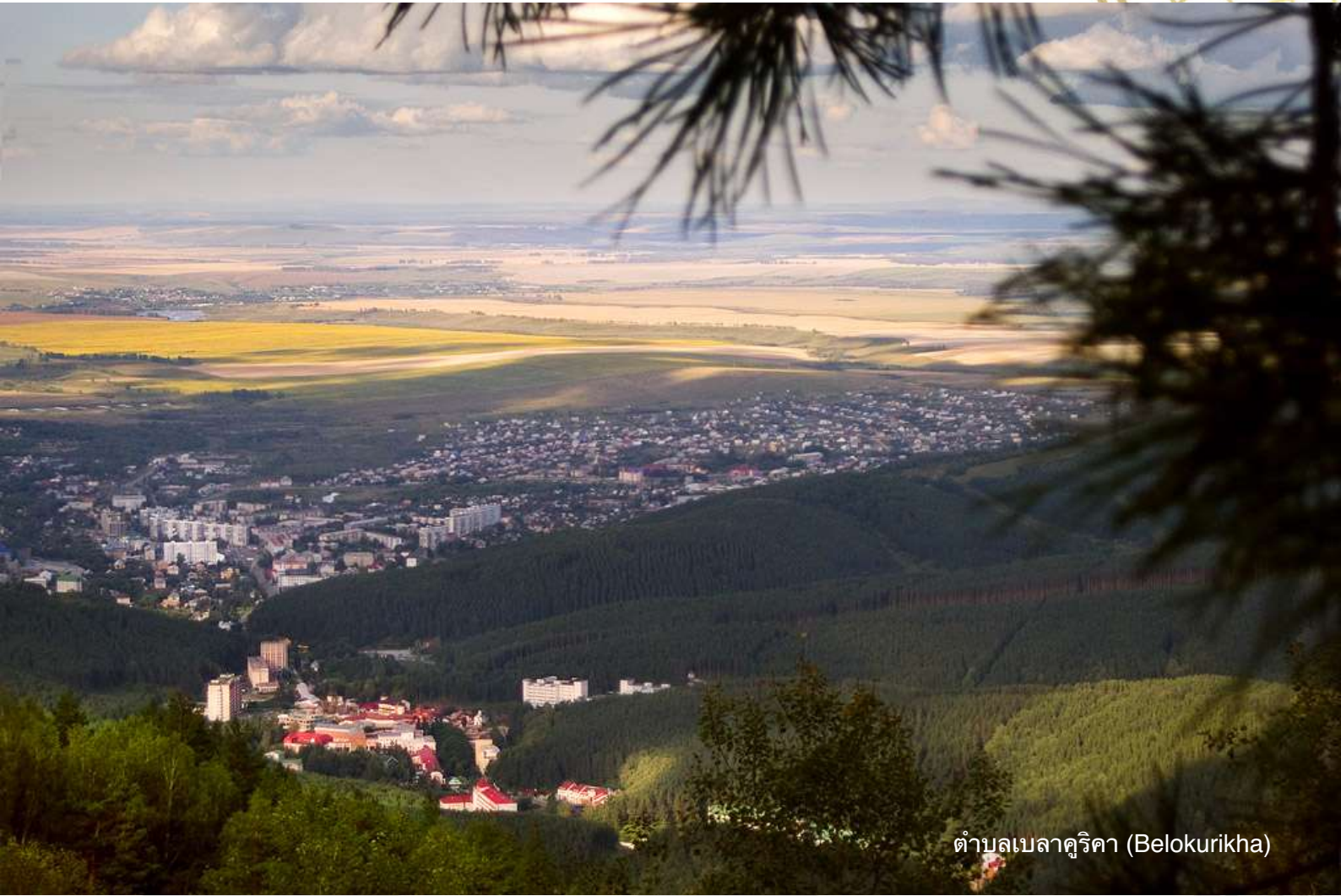
ตำบลเบลาคูริคา (Belokurikha)