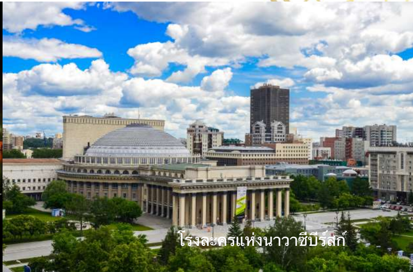
โรงละครแห่งนาวาซีบีร์สค์