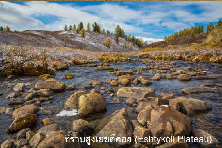
ที่ราบสูงเยชตีคอลล (Eshtykoll Plateau)