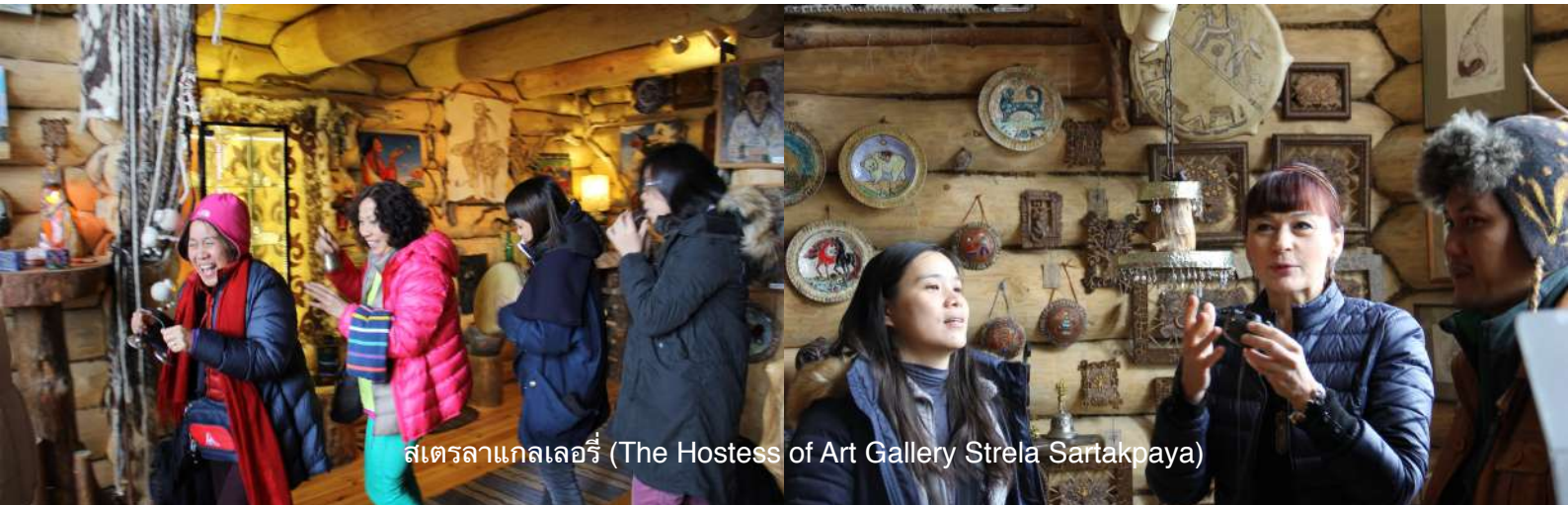
สเตรลาแกลเลอร์รี่ (The Hostess of Art Gallery Strela Sartakpaya)

ค่ำ ลัดเลาะไปตามแม่น้ำคาตุนจนกลับถึงที่พัก รับประทานอาหารค่ำ พักผ่อนตาม อัยาศัย ณ โรงแรม Salyut หรือเทียบเท่า (N4)