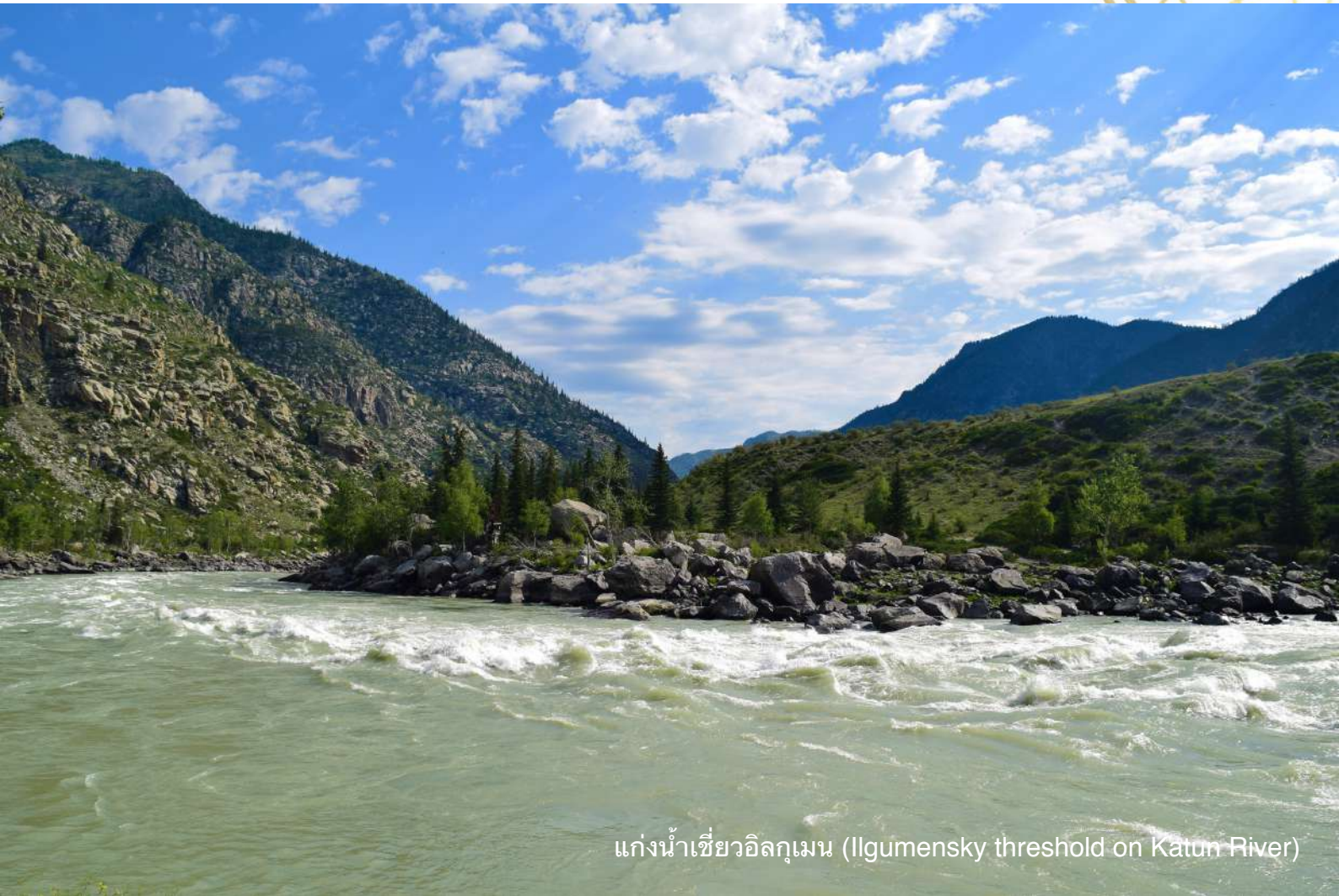
แก่งน้ำเชี่ยวอิลกูเมน (Ilgumensky threshold on Katun River)