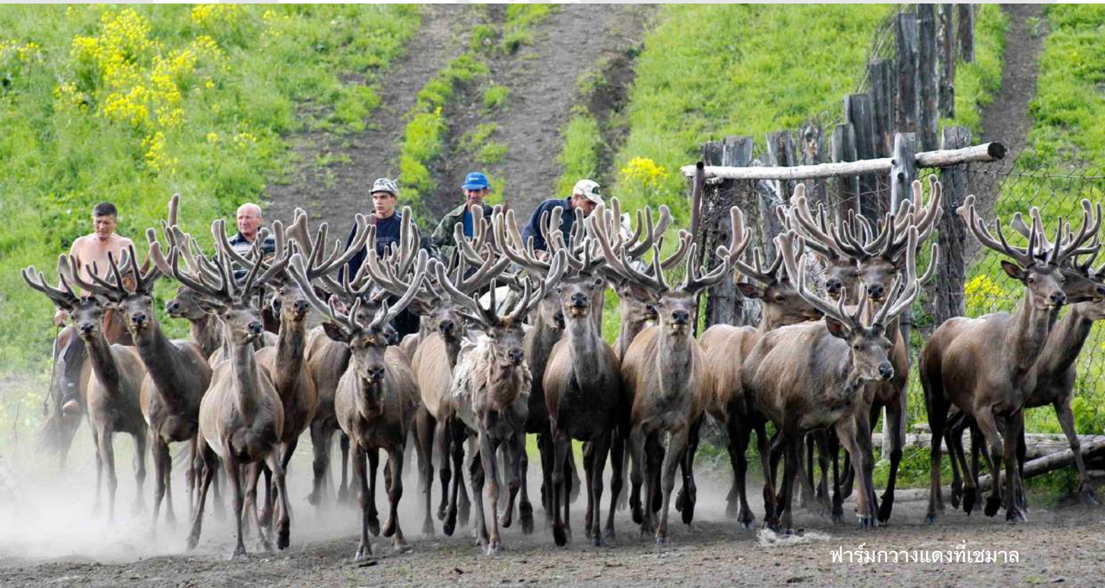
ฟาร์มกวางแดงที่เชมาล

18.00 น. รับประทานอาหารค่ำ พักผ่อนตามอัยาศัย ณ โรงแรม Salyut หรือเทียบเท่า (N3)