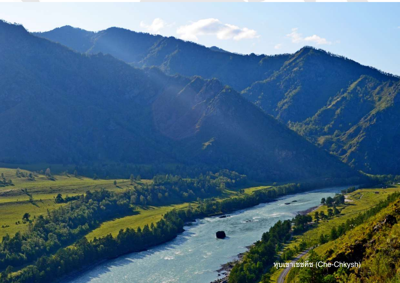
หุบเขาเซชคิช (Che-Chkysh)

เย็น รับประทานอาหารค่ำ พักผ่อนตามอัยาศัย ณ โรงแรม Salyut หรือเทียบเท่า (N5)