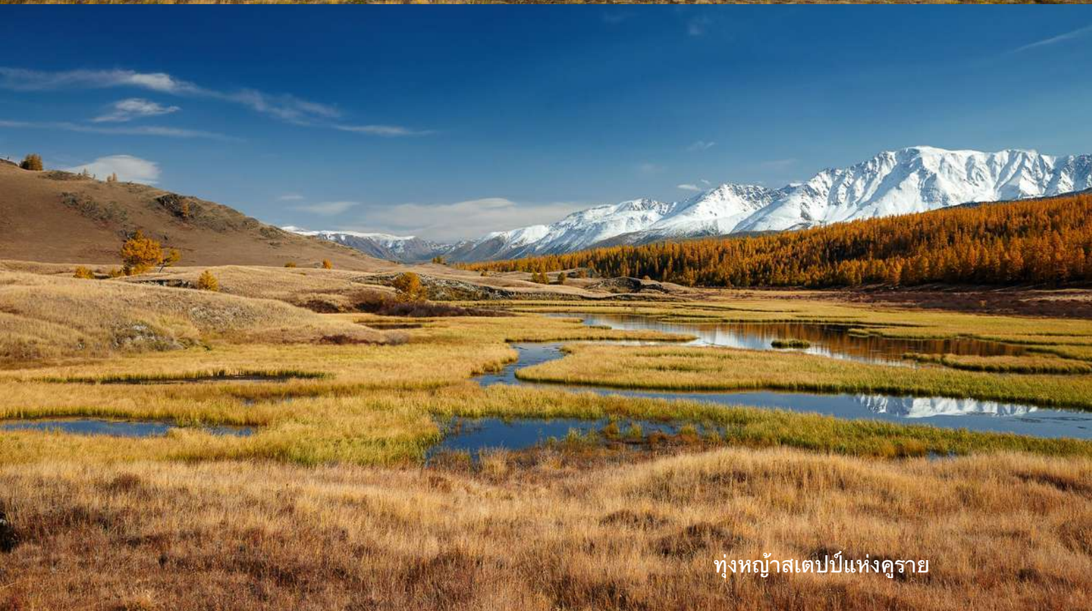
ทุ่งหญ้าสเดปป์แห่งคูราย