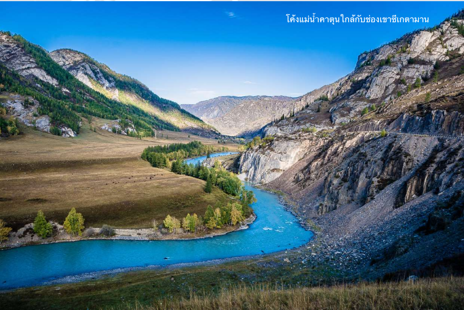
โค้งแม่น้ำคาตุน ไกลกับช่องเขาซีเกตามาน

14.00 น. รับประทานอาหารกลางวัน แล้วเดินทางต่อไปชมแก่งฮิปโป ซึ่งแม่น้ำคาตุนไหลเชี่ยวผ่านช่องหิน ต่อด้วยการไปชมหินสลักอักษรภาพกลางแจ้งอายุตั้งแต่ 2,000 - 5,000 ปี โดยภาพส่วนใหญ่เป็นภาพของแพะภูเขาไซบีเรีย กระตังเขายาว กวาง และนายพราน มีทฤษฎีว่าภาพเหล่านี้ถูกสลักขึ้นถวายเป็นของขวัญเพื่อให้ทวยเทพอวยพรให้การเลี้ยงสัตว์เป็นไปอย่างราบรื่น นอกจากนี้