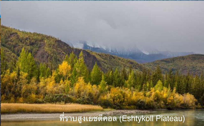
ที่ราบสูงเยชตีคอลล (Eshtykoll Plateau)