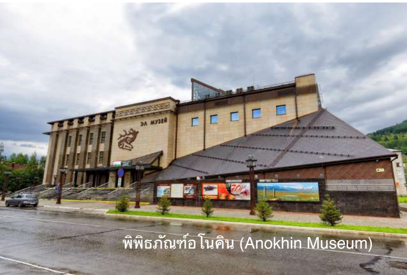
พิพิธภัณฑ์ทอโนคิน (Anokhin Museum)

19.00 น. รถไฟออกเดินทางสู่นครนาวาซีบีร์สค์ (ค้างคืนบนตู้นอนรถไฟและงดส่งเสียงดังบริเวณตู้นอน) (N9)