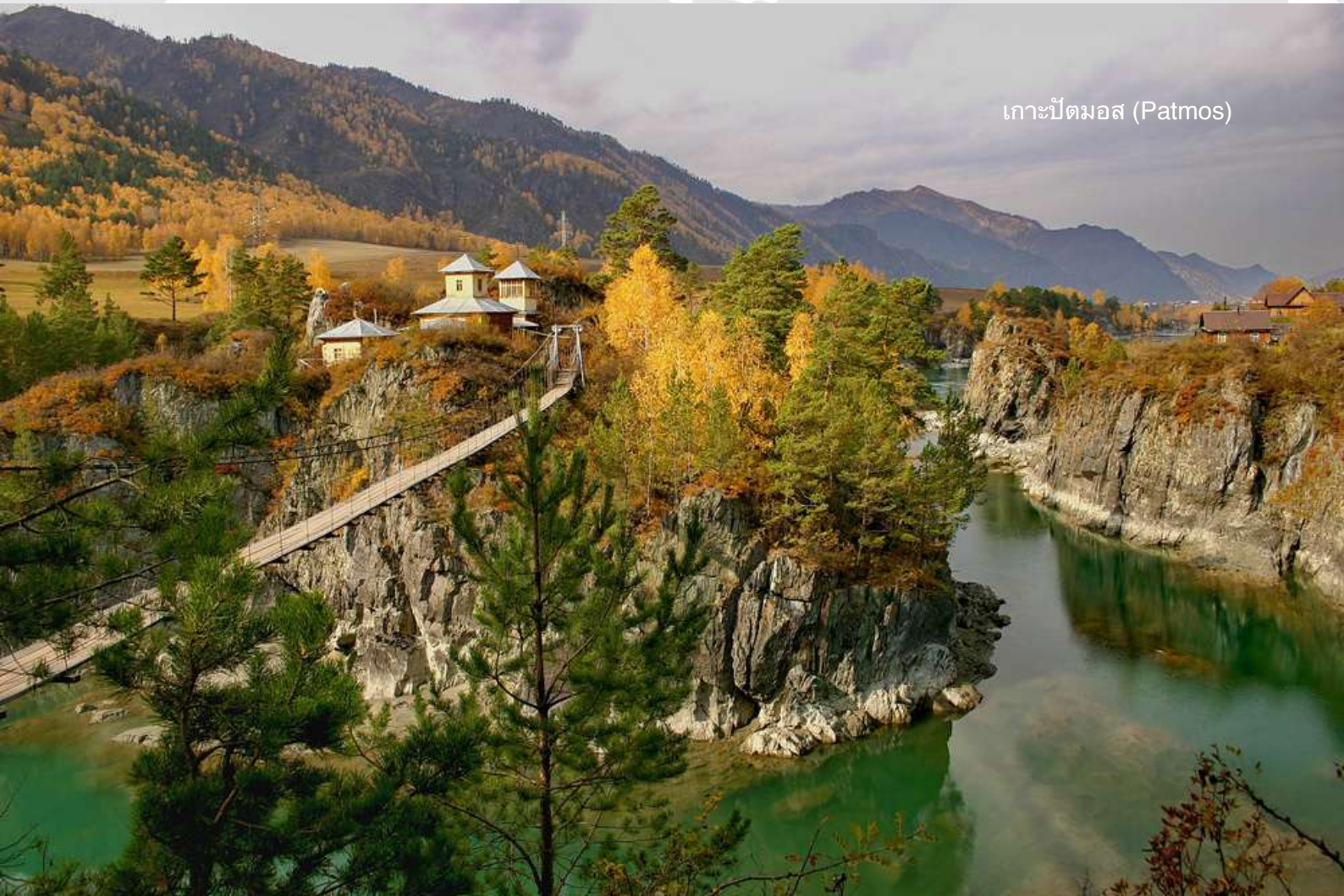
เกาะปัตมอส (Patmos)

09.00 น. ออกเดินทางสู่เกาะปัตมอส (Patmos) เกาะนี้ใช้ชื่อเดียวกับเกาะแห่งหนึ่งของกรีก ที่นักบุญยอห์นเคยไปบำเพ็ญเพียรภาวนา โดยวัดหลังแรกสร้างขึ้นเพื่อรำลึกถึงนักบุญยอห์นผู้ให้พันธพระวรสาร (St.John the Evangelist) ในปี ค.ศ. 1849 แต่ไม่ได้สร้างบนเกาะ ต่อมาในปี ค.ศ. 1915 จึงได้มีการย้ายไปสร้างบนเกาะปัตมอสแทน ในยุคสหภาพโซเวียตวัดแห่งนี้ถูกทำลายในปี ค.ศ. 1925 จนกระทั่งอีก 80 ปีต่อมา จึงได้มีการรื้อฟื้นวัดแห่งนี้ขึ้นใหม่ โดยอยู่ในความดูแลของสำนักอารามสตรีแห่งบาร์นาอูล ตัววัดสร้างอยู่บนเกาะกลางแม่น้ำคาตุน ที่ไหลกัดเซาะเดินผาหินเล็กๆ คล้ายกับเป็นแกรนด์แคนยอนขนาดย่อม นักท่องเที่ยวสามารถใช้สะพานแขวนเล็กๆ ข้ามแม่น้ำคาตุนเพื่อไปชมศาสนสถานแห่งนี้ได้