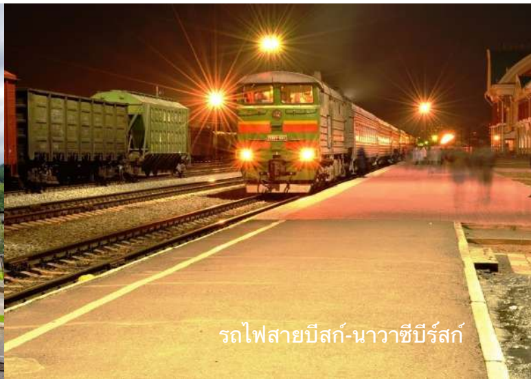
รถไฟสายบีสก์-นาวาซีบีร์สค์