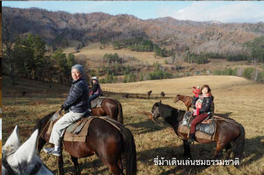
ขี่ม้าเดินเล่นชมธรรมชาติ