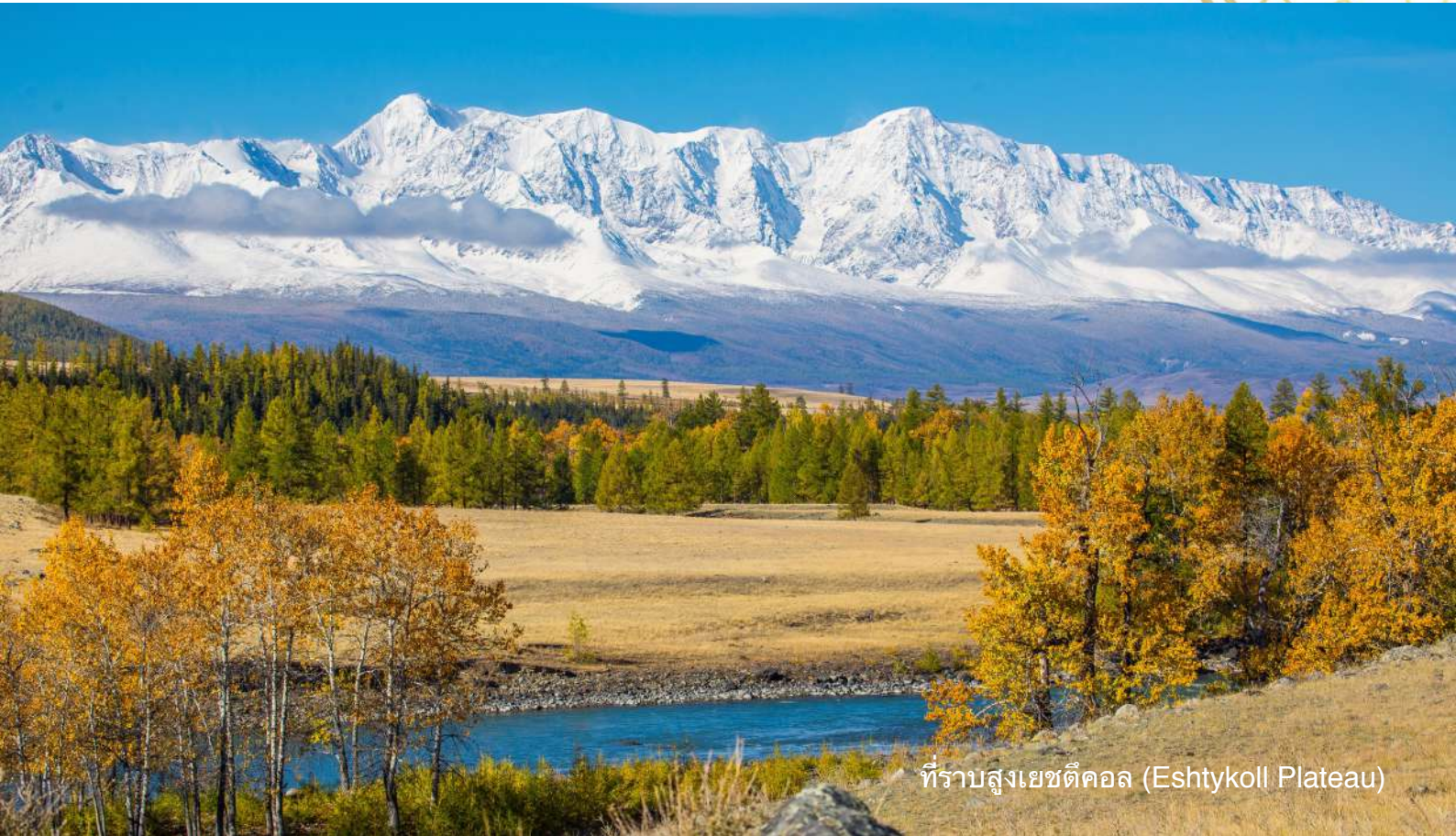
ที่ราบสูงเยชตีคอลล (Eshtykoll Plateau)