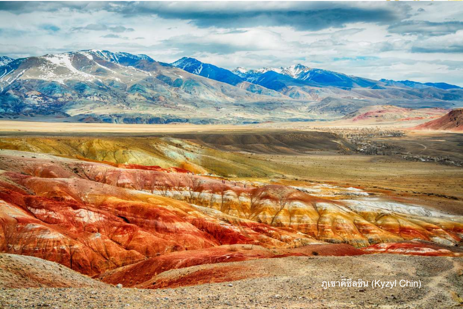
ภูเขาคีซึลชิน (Kyzyl Chin)