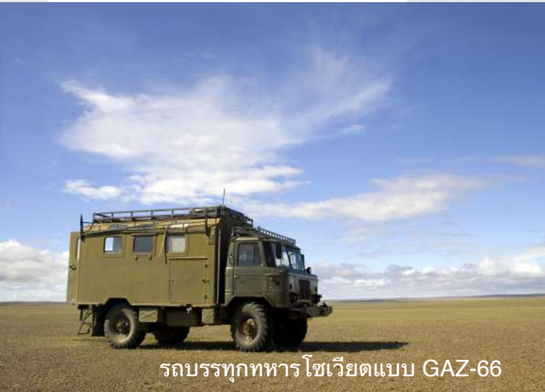
รถบรรทุกทหารโซเวียตแบบ GAZ-66

เย็น กลับที่พัก รับประทานอาหารค่ำ และพักผ่อนยามอัมฤชาศัย ณ โรงแรม Kochevnik หรือ เทียบเท่า