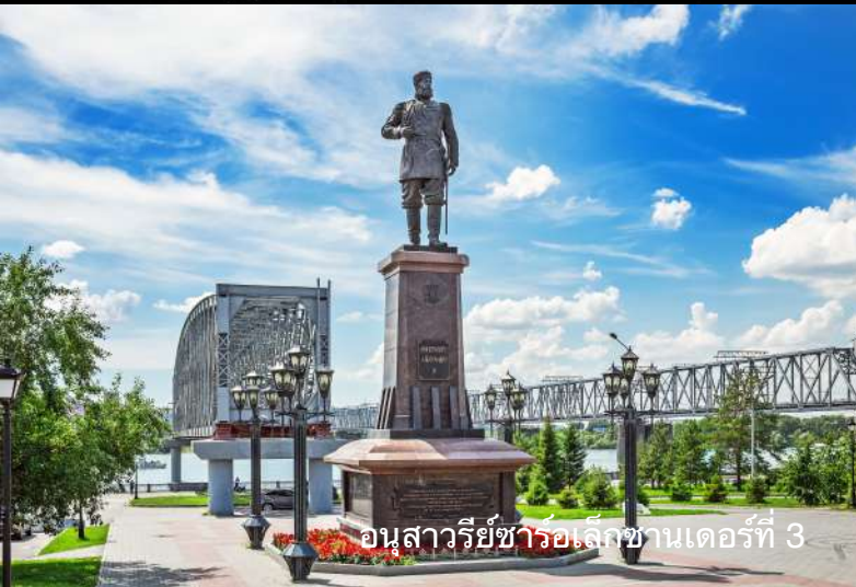
อนุสาวรีย์ชาร์อเล็กซานเดอร์ที่ 3