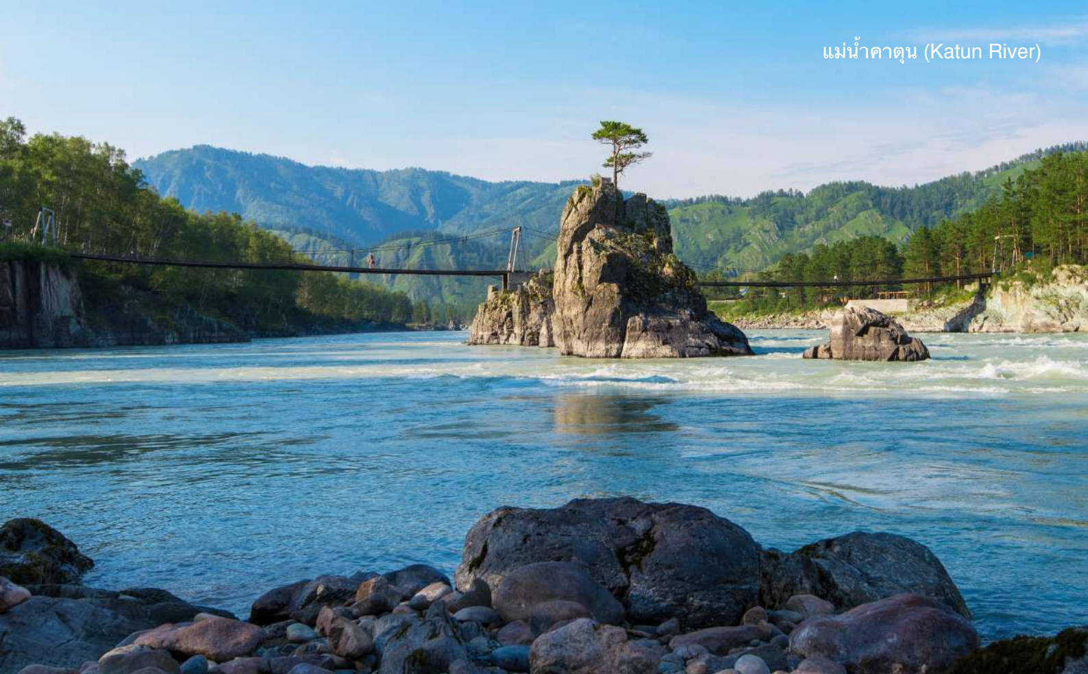
แม่น้ำคาตุน (Katun River)