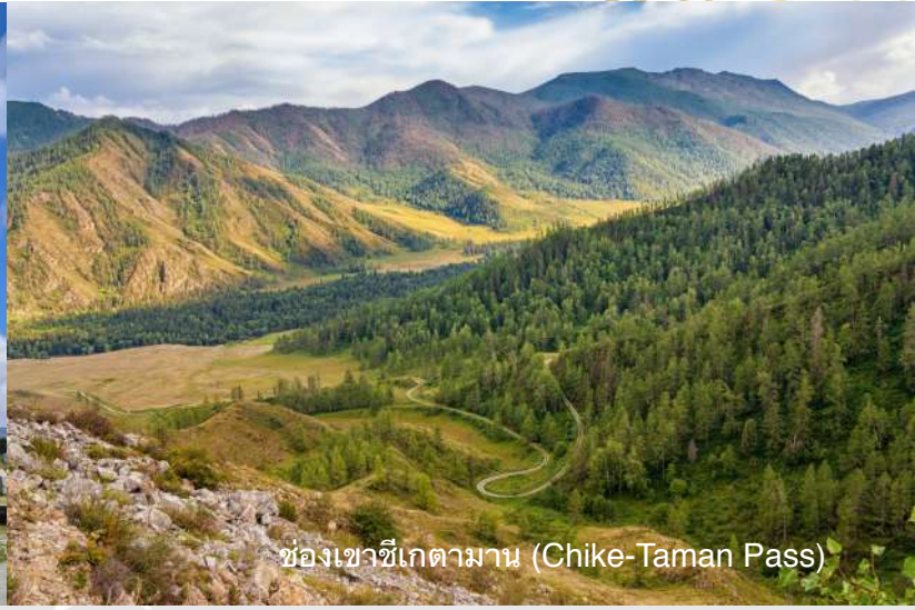
ช่องเขาซีเกตามาน (Chike-Taman Pass)