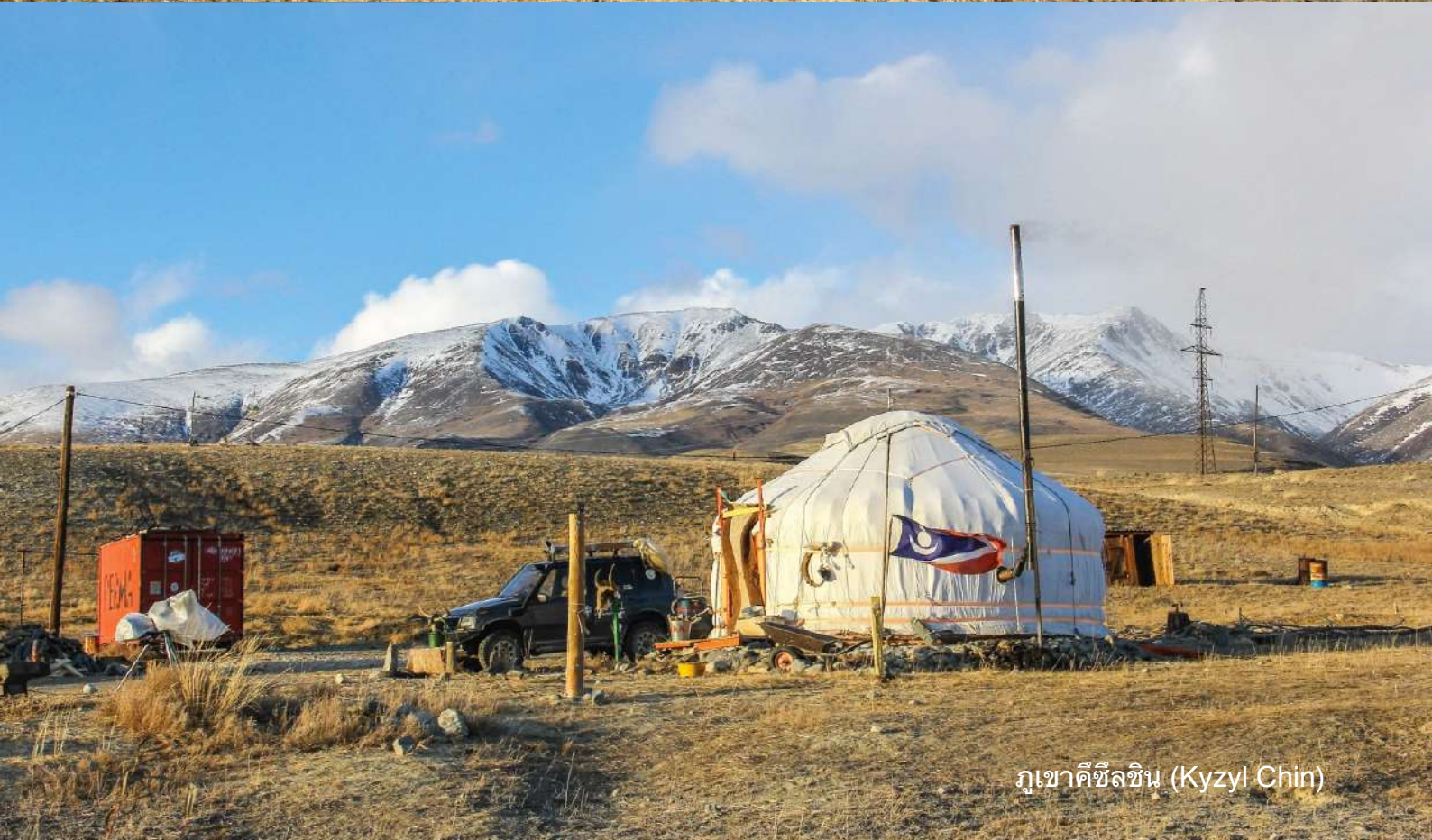
ภูเขาคีซึลชิน (Kyzyl Chin)