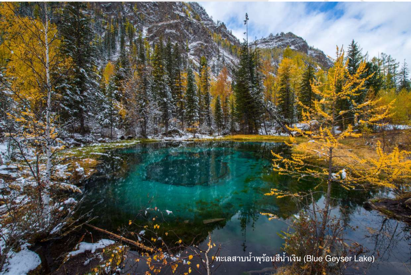
ทะเลสาบน้ำพุร้อนสีน้ำเงิน (Blue Geyser Lake)

ค่ำ รับประทานอาหารค่ำ พักผ่อนตามอัธยาศัย ณ โรงแรม Kochevnik หรือเทียบเท่า (N7)