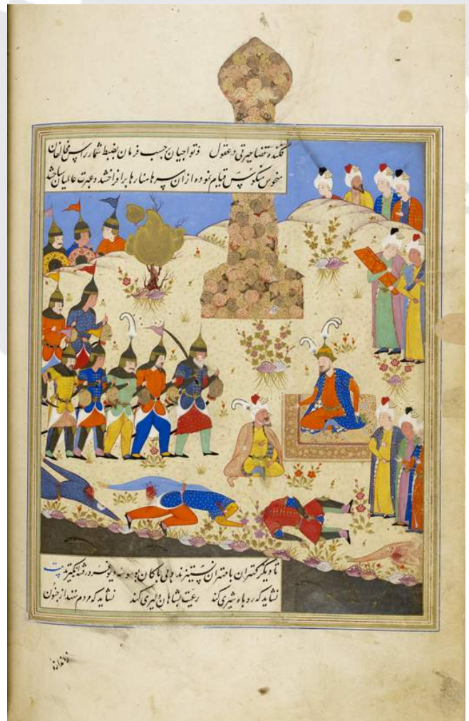
กองทหารเรียงแถวหน้าตีมีร์ โดยหัวศีรษะของศัตรูไว้ในมือ ด้านหลังมองเห็นกองศีรษะเรียงสูงเป็นหอคอย

ทั้งนี้ตีมีร์ไม่ได้สังหารผู้คนทั้งหมด แต่มีการกวาด