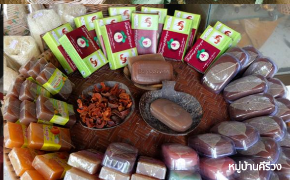
หมู่บ้านคีรีวง