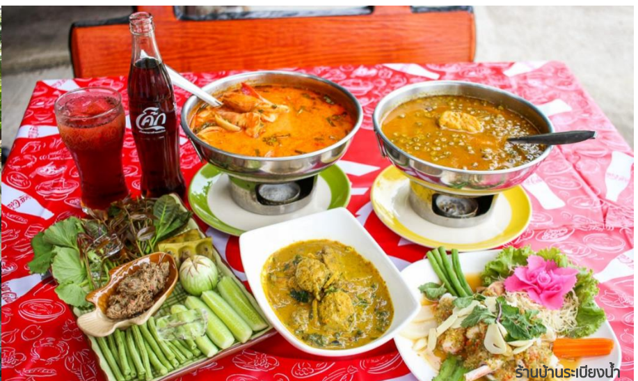
ร้านอาหารระเมียงน้ำ