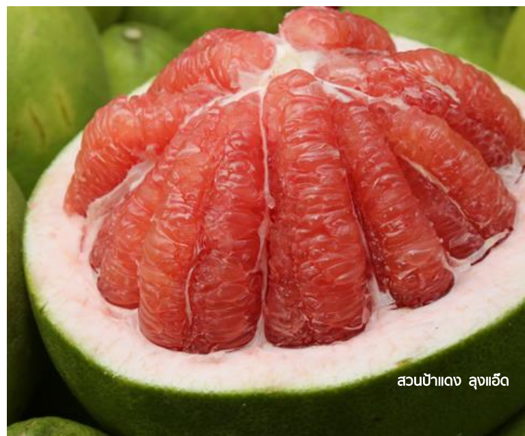
สวนป่าแดง ลุงแฉัด