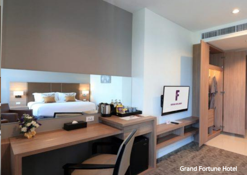
Grand Fortune Hotel

15.30 น. นำท่านออกเดินทางสู่เมืองนครศรีธรรมราช