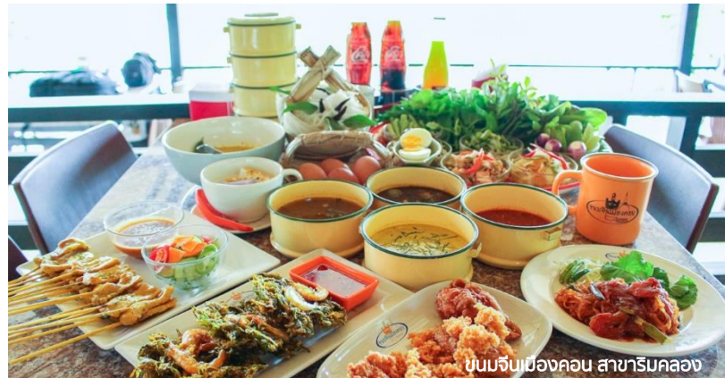
ขนมจีนเมืองคอน สาขาริมคลอง

บ่าย นำท่านสูดอากาศบริสุทธิ์ให้ชุ่มปอด ณ หมู่บ้านคีรีวง ชุมชนเก่าแก่ที่อพยพไปอาศัยอยู่เชิงเขาหลวง เดิมชุมชนนี้มีชื่อว่า "บ้านขุนน้ำ" เพราะตั้งอยู่ใกล้ต้นน้ำจากยอดเขาหลวง ต่อมาเปลี่ยนเป็นชื่อ "บ้านคีรีวง" หมายถึง หมู่บ้านซึ่งอยู่ภายในวงล้อมของภูเขา สนุกสนานกับกิจกรรมเวิร์คช็อปทำผ้ามัดย้อม (กระพ้ำขีดหน้า) จากนั้นนำท่านชมการสาธิตการทำสบู่จากเปลือกมังคุด อีกหนึ่งผลิตภัณฑ์ที่สร้างชื่อเสียงให้กับชุมชน