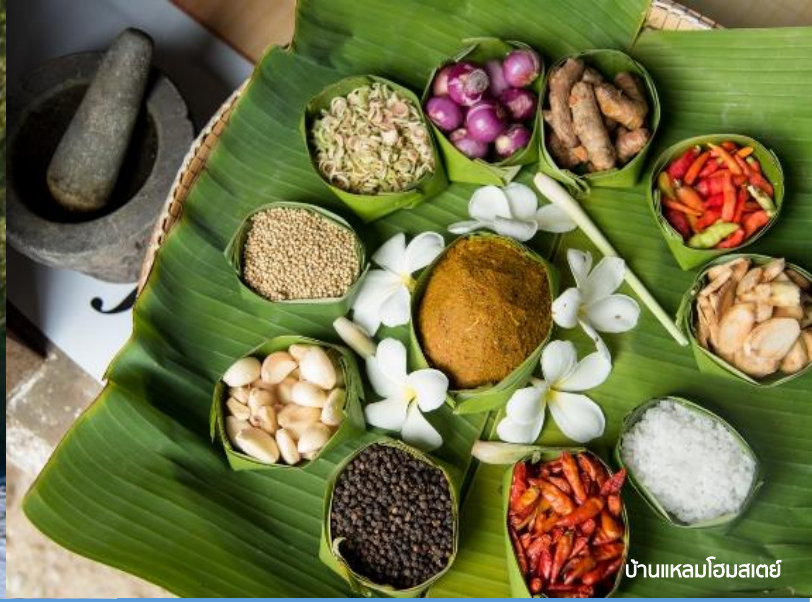
บ้านแหลมโฮมสเตย์