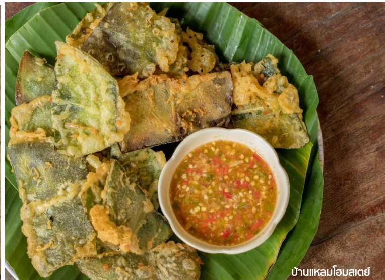
บ้านแหลมโฮมสเตย์