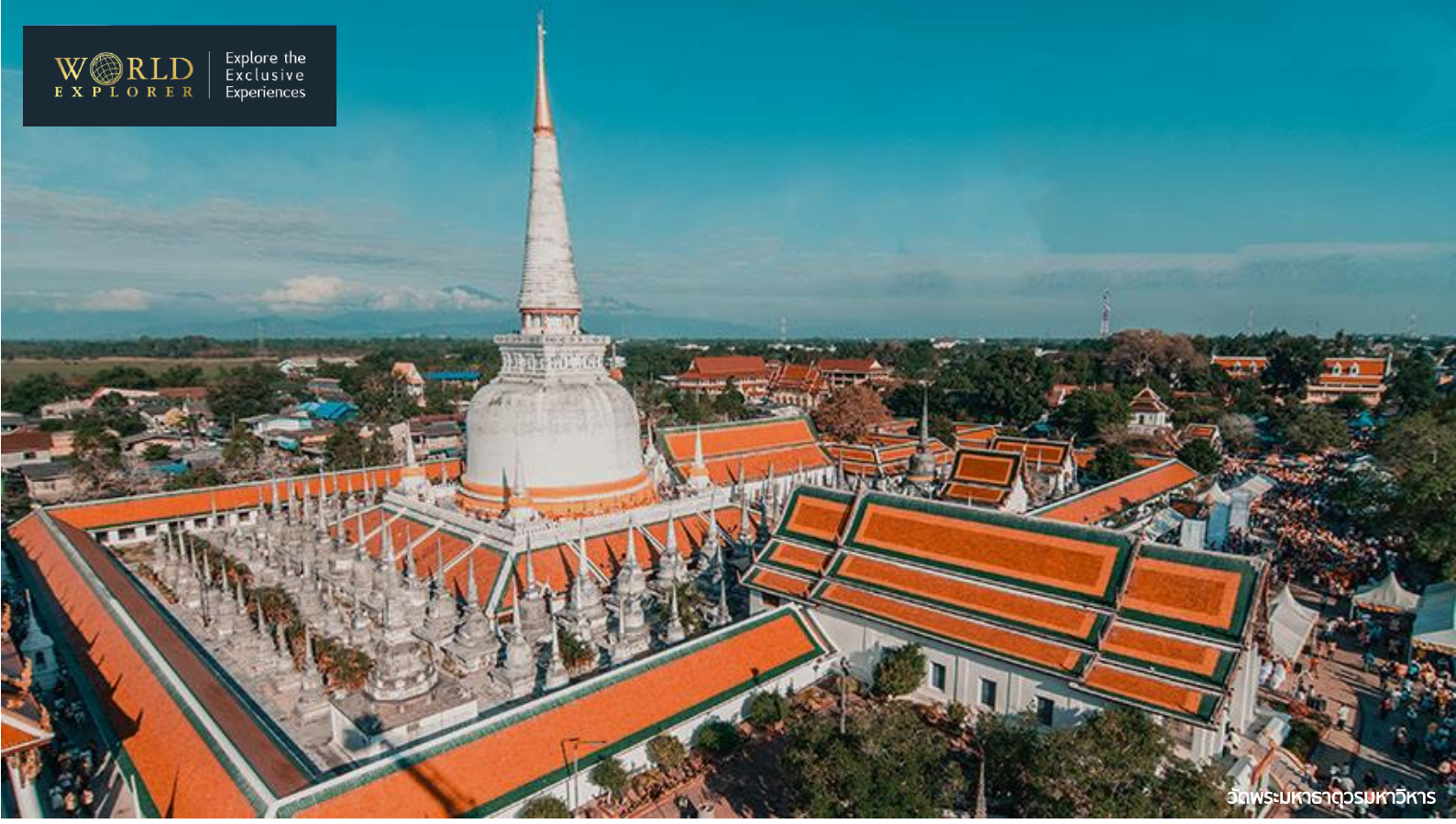
วัดพระมหาธาตุวรมหาวิหาร