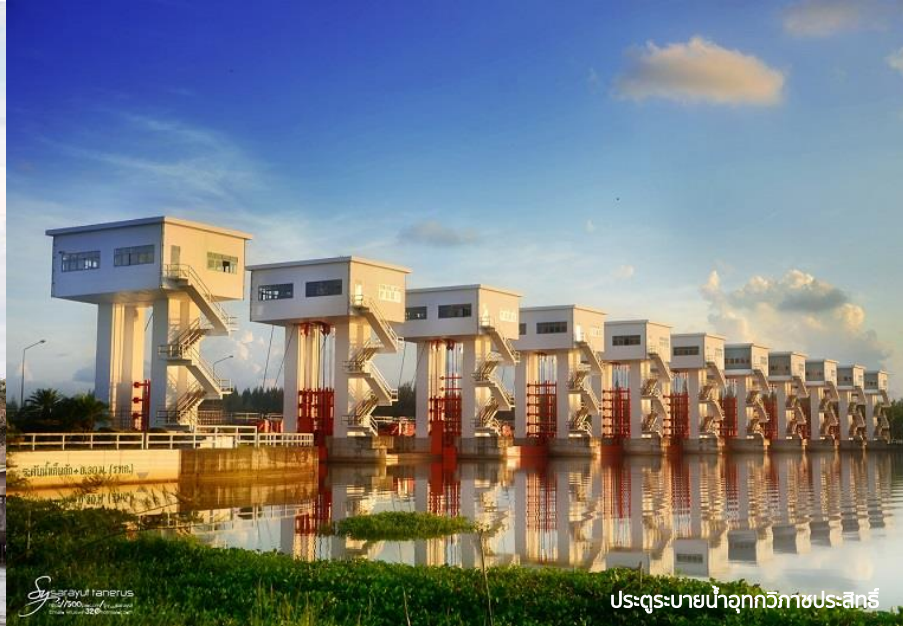
ประตุน้ำอุทกวิทยาประสิทธิ์