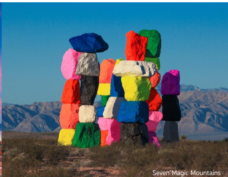
Seven Magic Mountains