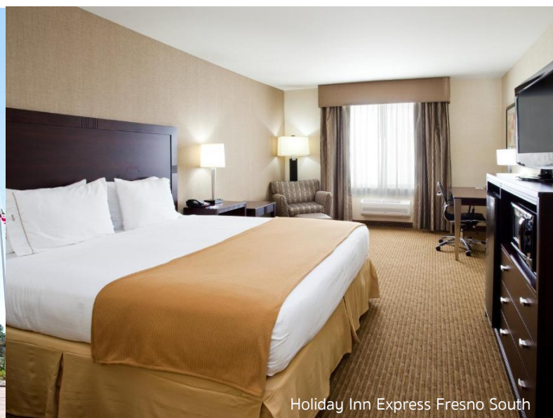
Holiday Inn Express Fresno South