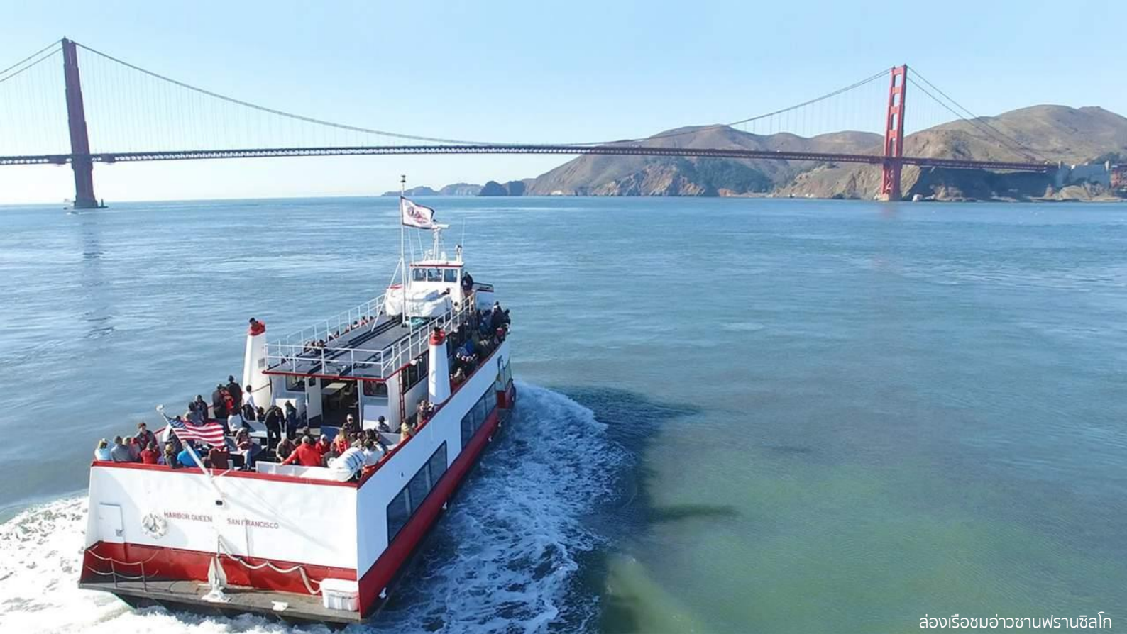
ล่องเรือชมอ่าวซานฟรานซิสโก

บ่าย เดินทางสู่ ท่าเรือฟิชเชอร์แมนวาร์ฟ (Fisherman's Wharf) เป็นศูนย์กลางการท่องเที่ยวที่เต็มไปด้วยร้านค้า ร้านอาหาร สวนสนุก พิพิธภัณฑ์สัตว์น้ำ และเป็นที่ตั้งของ PIER 39 จุดที่มีสิงโตทะเลมาอนออบแดดนับร้อยตัว ให้ท่านอิสระเลือกซื้อสินค้าของที่ระลึก นำท่าน ล่องเรือชมอ่าวซานฟรานซิสโก (ใช้เวลาล่องเรือประมาณ 1 ชั่วโมง) โดยเรือจะผ่านชมเกาะอัลคาทราซ(Alcatraz) เกาะที่เคยเป็นที่คุมขังนักโทษอเมริกาในอดีต จากนั้นชมอีกหนึ่งแลนด์มาร์คสำคัญ ลอมบาร์ดสตรีท (Lombard Street) ถนนที่ลาดชันและคดเคี้ยวที่สุดในโลก ตั้งอยู่ระหว่าง Jones Street และ Hyde Street มีลักษณะเป็นถนนที่คดเคี้ยวแบบโค้งหักศอกอยู่บนเนินชัน มีทั้งหมด 8 โค้ง เป็นโค้งช่วงสั้น ๆ และแคบมาก รอบข้างของถนนเส้นนี้จะเป็นบ้านเรือนอันสวยหรูสไตล์วิกตอเรียน มีการประดับประดาถนนด้วยต้นไม้และดอกไม้สวยงาม