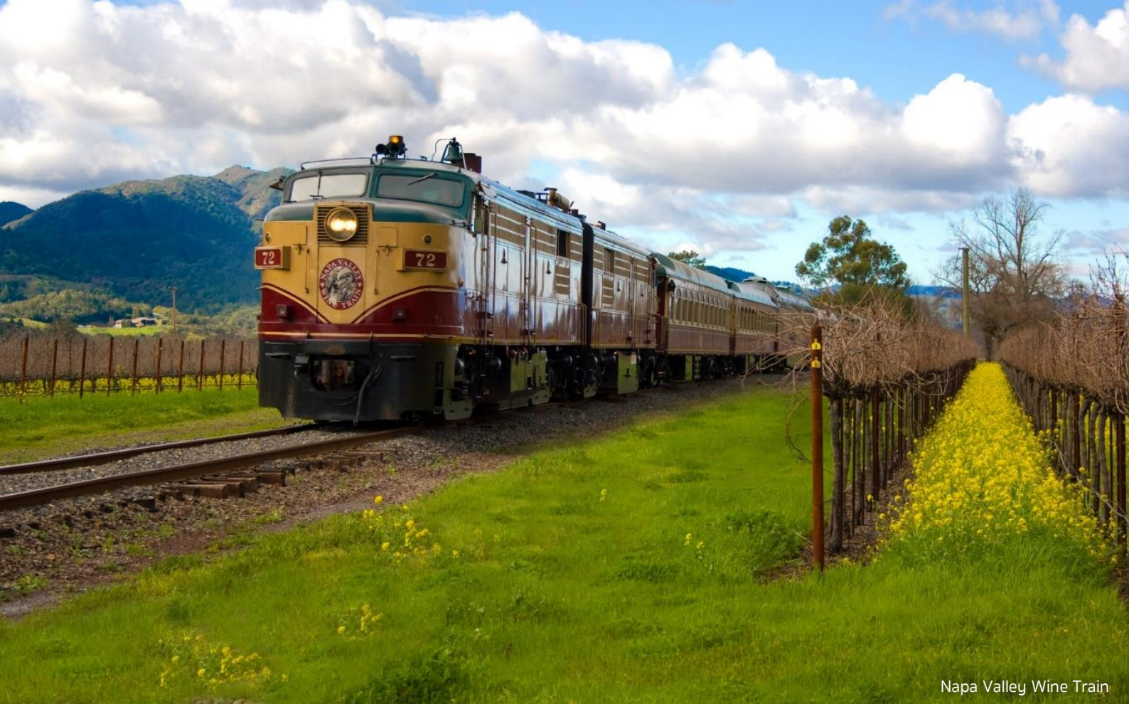
Napa Valley Wine Train