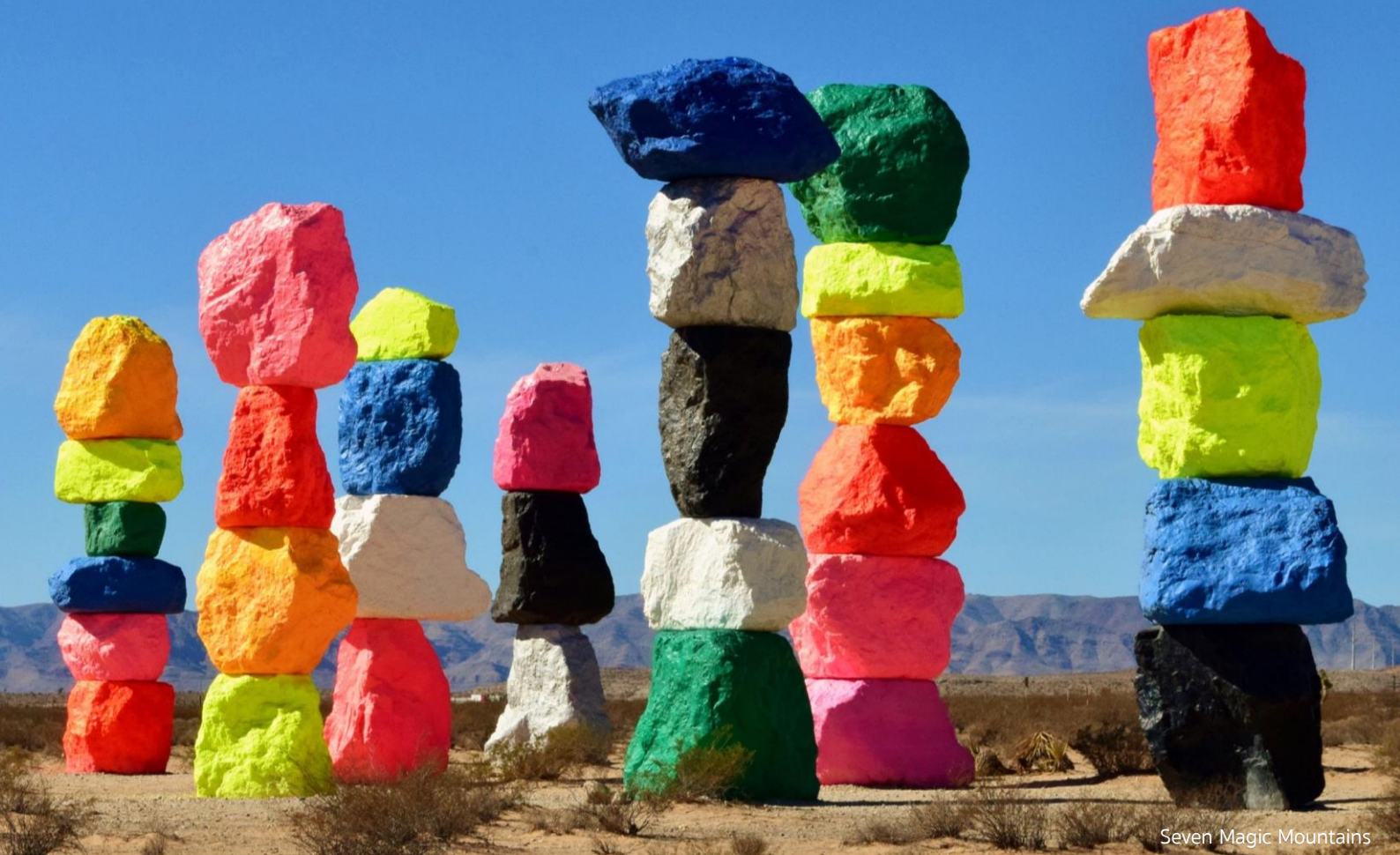
Seven Magic Mountains