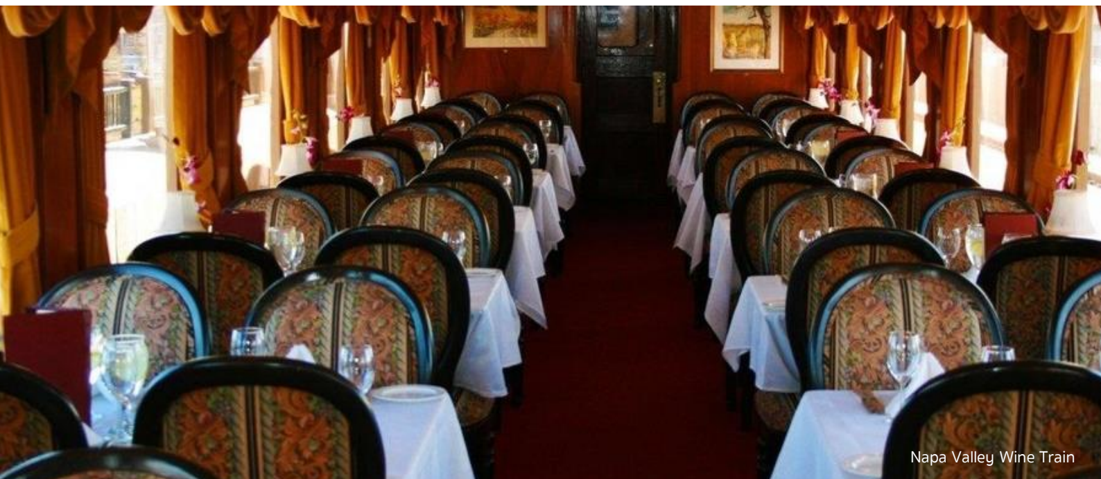
Napa Valley Wine Train