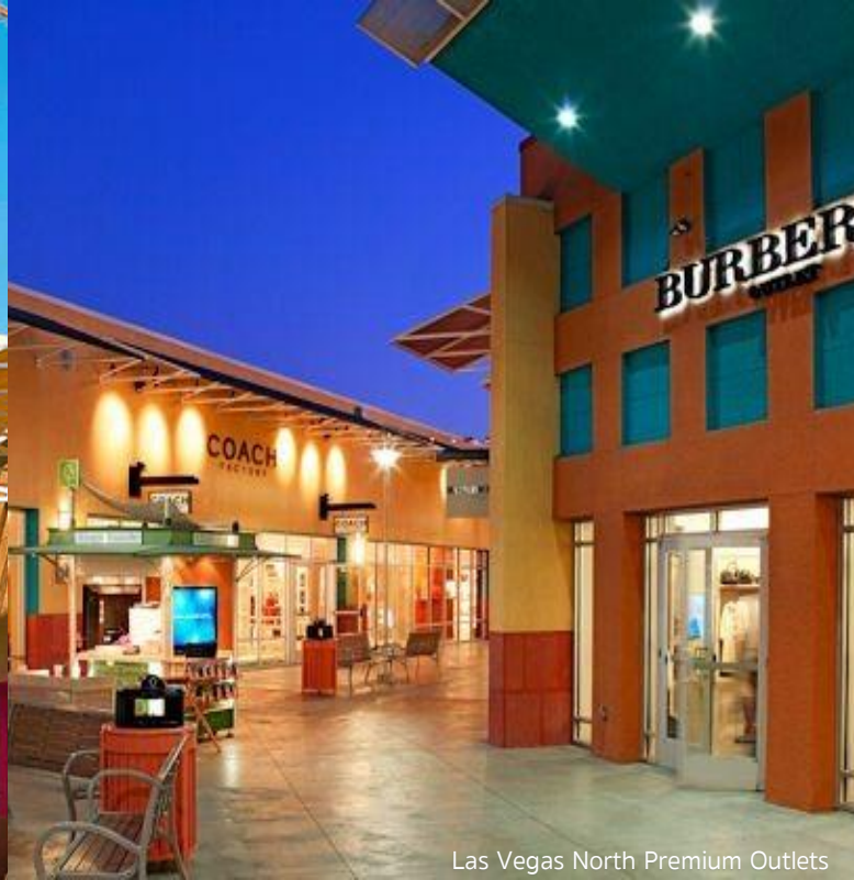
Las Vegas North Premium Outlets