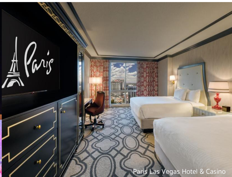
Paris Las Vegas Hotel & Casino