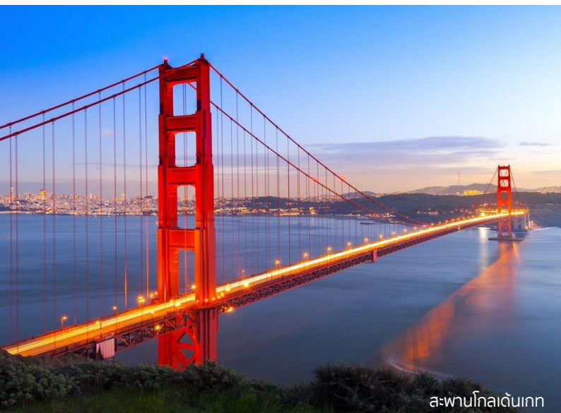
สะพานโกลเดนเกต

เช้า รับประทานอาหารเช้า ณ ห้องอาหารของโรงแรม 09.30 น. นำท่านเที่ยวชม เมืองซานฟรานซิสโก นครมหาเสน่ห์แห่งมลรัฐแคลิฟอร์เนียตอนเหนือ นำท่านขึ้นเขาทวินพีค (Twin Peaks) จุดชมวิวของเมืองซานฟรานซิสโกที่สวยงามที่สุด เดินทางสู่อัลลาโมสแควร์ (Alamo Square) ชมและถ่ายรูปภายนอกกับสถาปัตยกรรมแบบโดมโค้ง สไลด์สวิตตอเรียผสมผสานกับวัฒนธรรมแบบอเมริกาที่รู้จักกันในนาม Painted Ladies หนึ่งในสถานที่ ยอดฮิตที่ภาพยนตร์ฮอลลีวูด นิยมมาถ่ายทำ แวะถ่ายภาพ สะพานโกลเดนเกต เป็นที่ระลึกสะพานที่เคยได้ชื่อว่าเป็นสะพานแขวนที่ยาวที่สุดในโลก เที่ยง อาหารกลางวัน อิสระตามอัธยาศัย