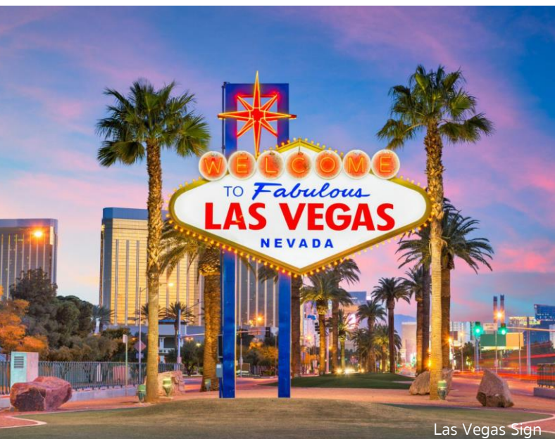
Las Vegas Sign

เช้า 09.00 น. รับประทานอาหารเช้า ณ ห้องอาหารของโรงแรม แวะถ่ายรูปเป็นที่ระลึกกับ Las Vegas Sign ป้ายที่เป็นสัญลักษณ์ของเมืองลาสเวกัส ตั้งอยู่บนต้นสายของ Strip Street ถูกสร้างขึ้นเมื่อปี ค.ศ. 1959 ชม Seven Magic Mountains งาน Art ที่สร้างสรรค์โดย Ugo Rondinone ศิลปินชาวสวิส โดยเป็นหินหลากหลายสีสลับเรียงขึ้นไปเป็น Tower รวม 7 ชุด มีความสูงกว่า 30 ฟุต เพื่อสื่อถึงความสุขของมนุษย์ท่ามกลางทะเลทราย จากนั้นเดินทางสู่ นครลอสแอนเจลิส (Los Angeles) เมืองใหญ่ที่มีประชากรมากที่สุดอันดับ 2 ในสหรัฐอเมริกา หนึ่งในศูนย์กลางทางด้านเศรษฐกิจ วัฒนธรรม และการบันเทิง (ใช้เวลาเดินทางประมาณ 3 ชั่วโมง 30 นาที)