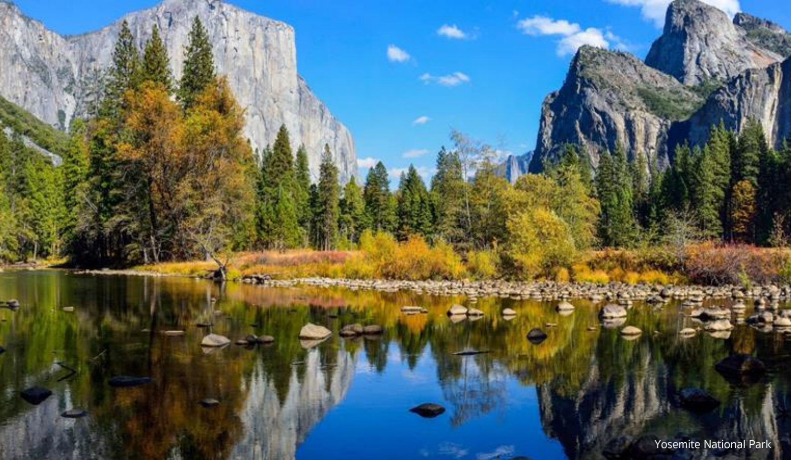
Yosemite National Park