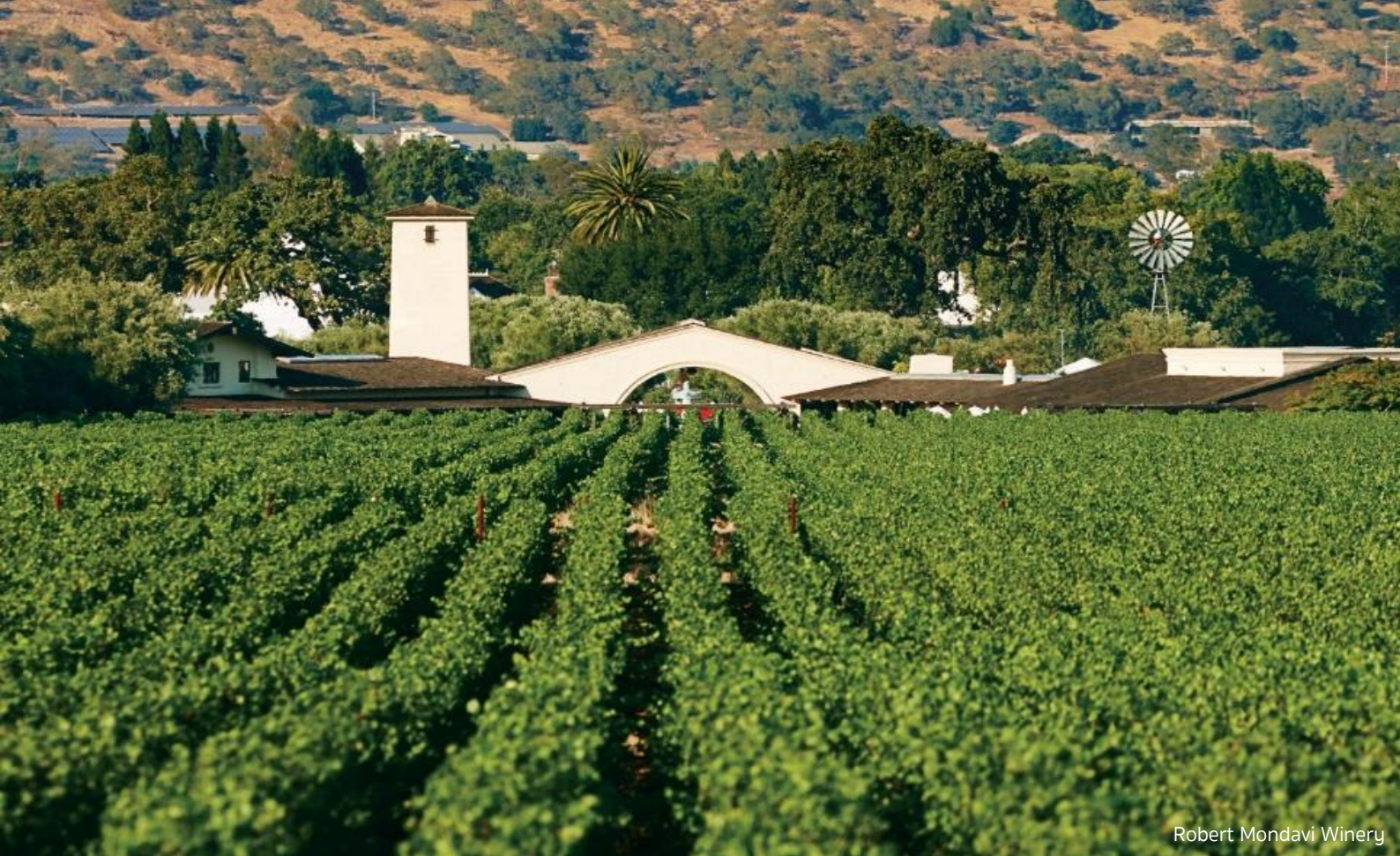
Robert Mondavi Winery

14.30 น. นำท่านสู่ โรงไวน์ของ Robert Mondavi ก่อตั้งเมื่อปี 1966 ถือว่าเป็นหนึ่งในผู้บุกเบิกไวน์นาปาวัลเลย์ ได้รับเลือกโดย World's Best Vineyards ให้เป็น vineyard อันดับ 1 ในอเมริกาเหนือ และเป็น Winery อันดับ 5 ที่นำไปเที่ยวชมมากที่สุดในโลก ใช้อุ่นจาก "To Kalon" ไร่เก่าแก่กว่า 150 ปี ที่ขึ้นชื่อเรื่อง องุ่นพันธุ์ Cabernet Sauvignon และ Sauvignon Blanc ชั้นเยี่ยม เป็นแหล่งกำเนิดของไวน์ชนิดพิเศษ Fumé Blanc ที่โรเบิร์ตเป็นคนคิดค้นขึ้น Wine Tasting ให้ท่านได้ลองชิมไวน์ชั้นชื่อของที่นี่ พร้อมชมทิวทัศน์ไร่องุ่นที่สวยงาม จากนั้นเดินทางกลับ เมืองซานฟรานซิสโก